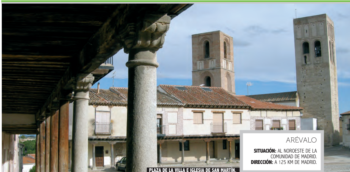
PLAZA DE LA VILLA E IGLESIA DE SAN MARTÍN.